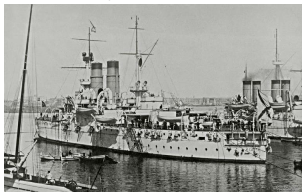
Эскадренный броненосец "Сисой Великий" в Неаполе на пути в Балтийское море, 1902 год.