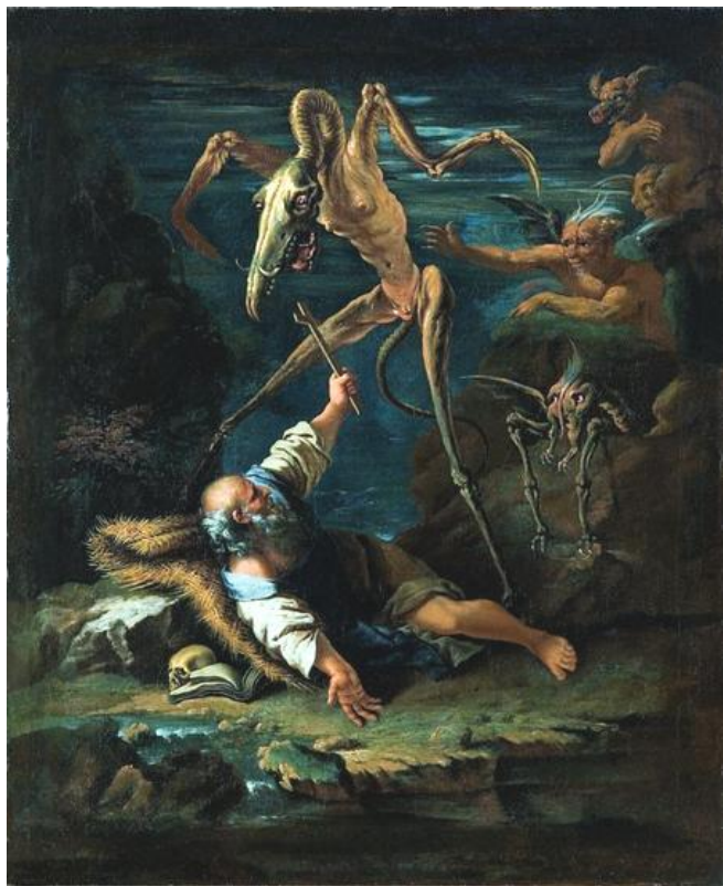
"Искушение Святого Антония". Художник Сальватор Роса.

Измлада возлюбив Бога, преподобный Сисой взял на себя иго креста и с усердием последовал за Христом, подвизаясь в пустынях египетских подвигами поста; он проводил жизнь равноангельскую, – смирением и молитвою побеждая полчища невидимых врагов. Местом его подвигов была пустынная гора, в которой подвизался преподобный Антоний Великий .